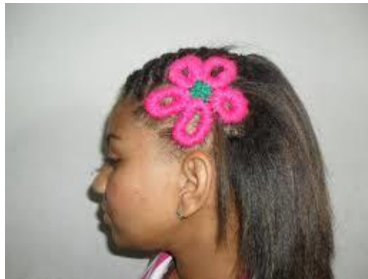
Figura 1. Trança nagô/raiz modelo flor

Neste penteado verificamos os seguintes conteúdos matemáticos: